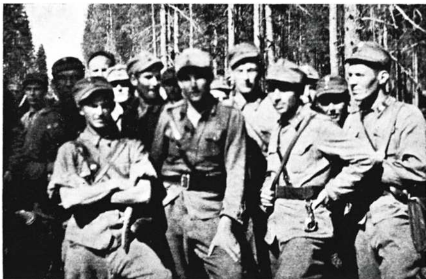
Vanha kotimaan raja ylitetään jälleen 7. 7. 44. III/JR9:n poikia Hiisjärvellä