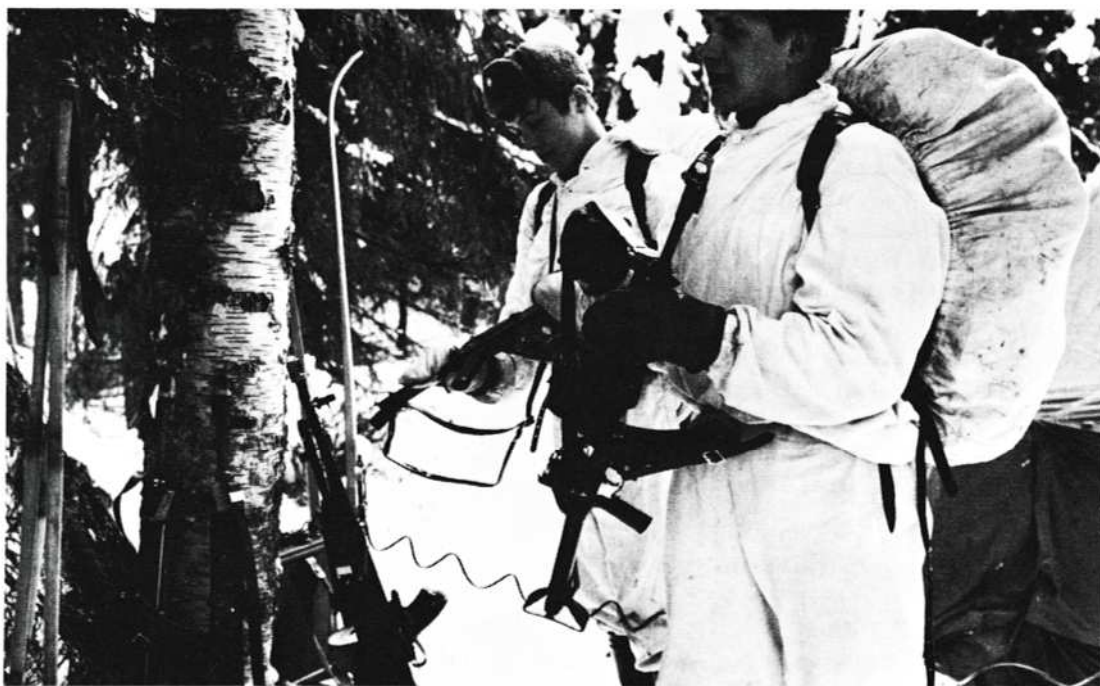
Sissit valmistautuvat iskuun