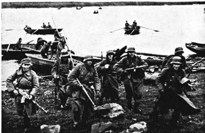
Ensimmäinen porras I/JR9:stä nousee maihin Vosneseniassa