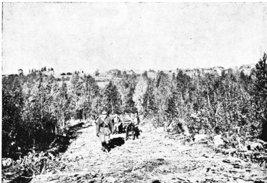
Lähtö korpeen. Taustalla Kaskanan kylä