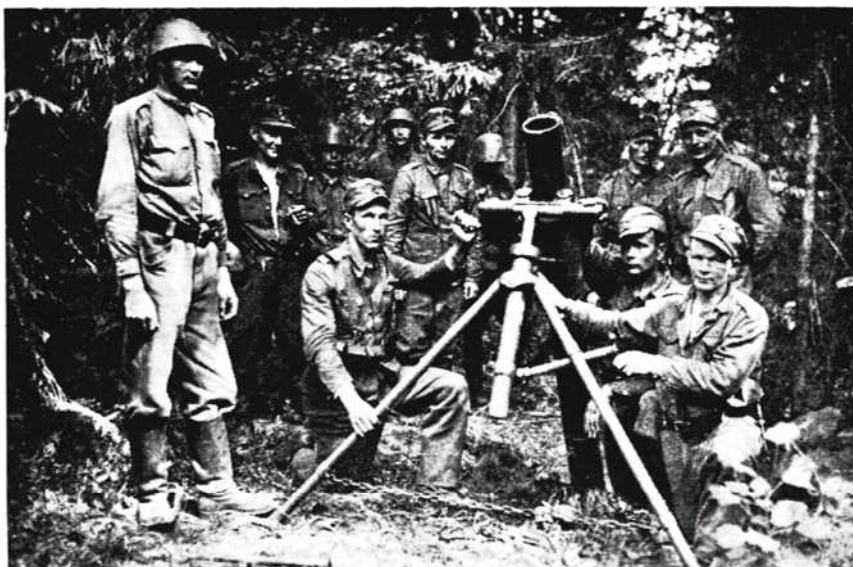
I/JR 9:n krh-komppanian heitin tuliasemassa

Ida sai vastauksen: "Älä sure, jos kaadun, rupean hovikummitukseksi hoviisi, sehän sinulta puuttuu."