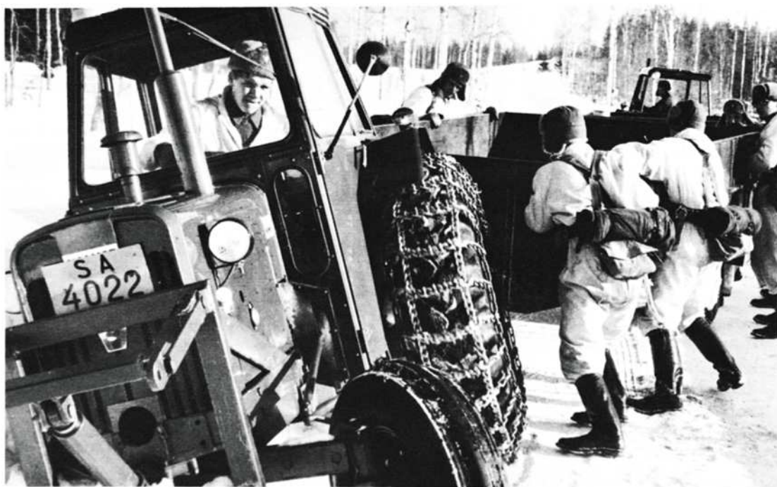
Moottoroinnin aiheuttamia pulmia "maantielehmän" puitteissa.