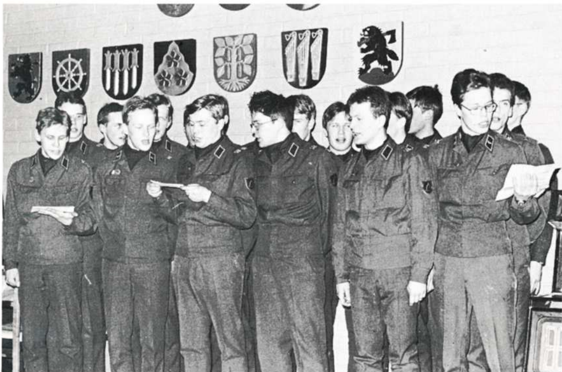
38 Kurssin kuoro