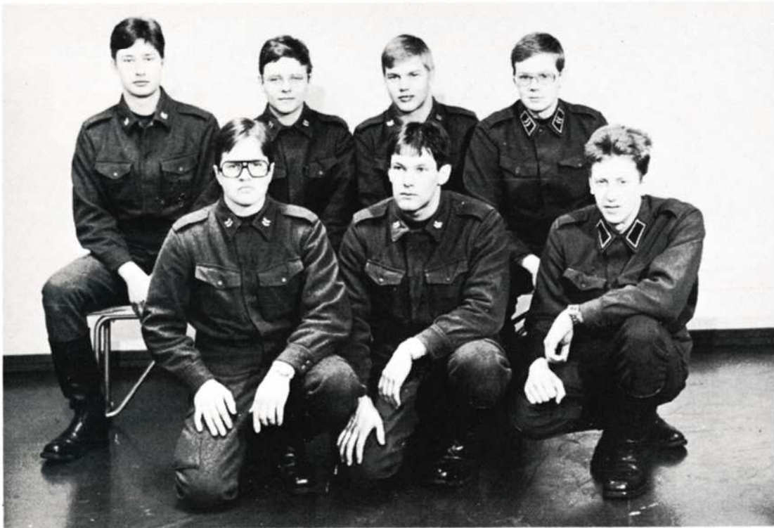
Apukoulttajat, toimisto-au ja kirjuri