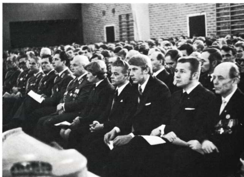
Voimistelusalissa pidetyn juhlan yleisöä

Vuosijuhlissa palkittiin pataljoonan ystäviä ja omaakin väkeä