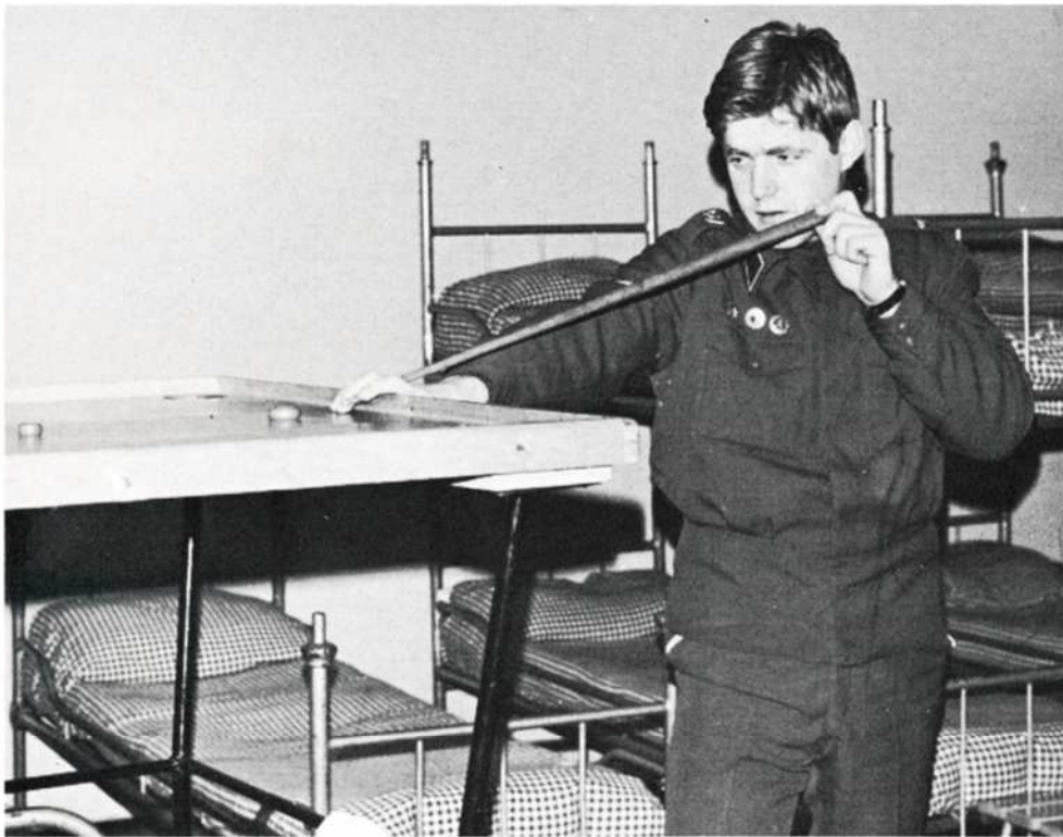
Fräs "Pörssin vapaa-ajan harrastuksista