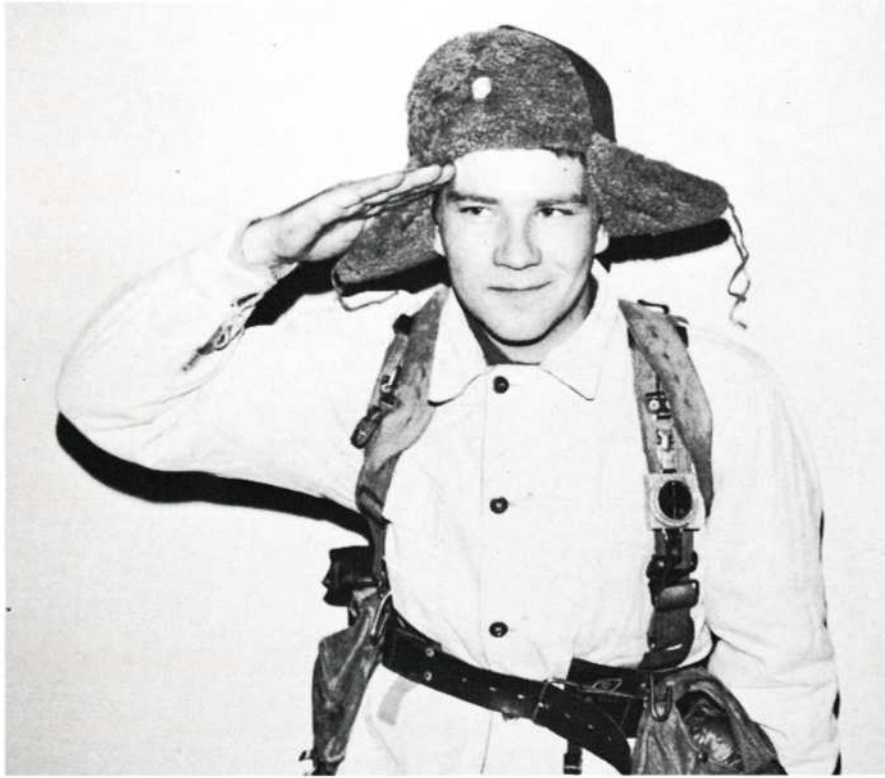
Kurssi tervehtii Teitä arvoisat lukijat