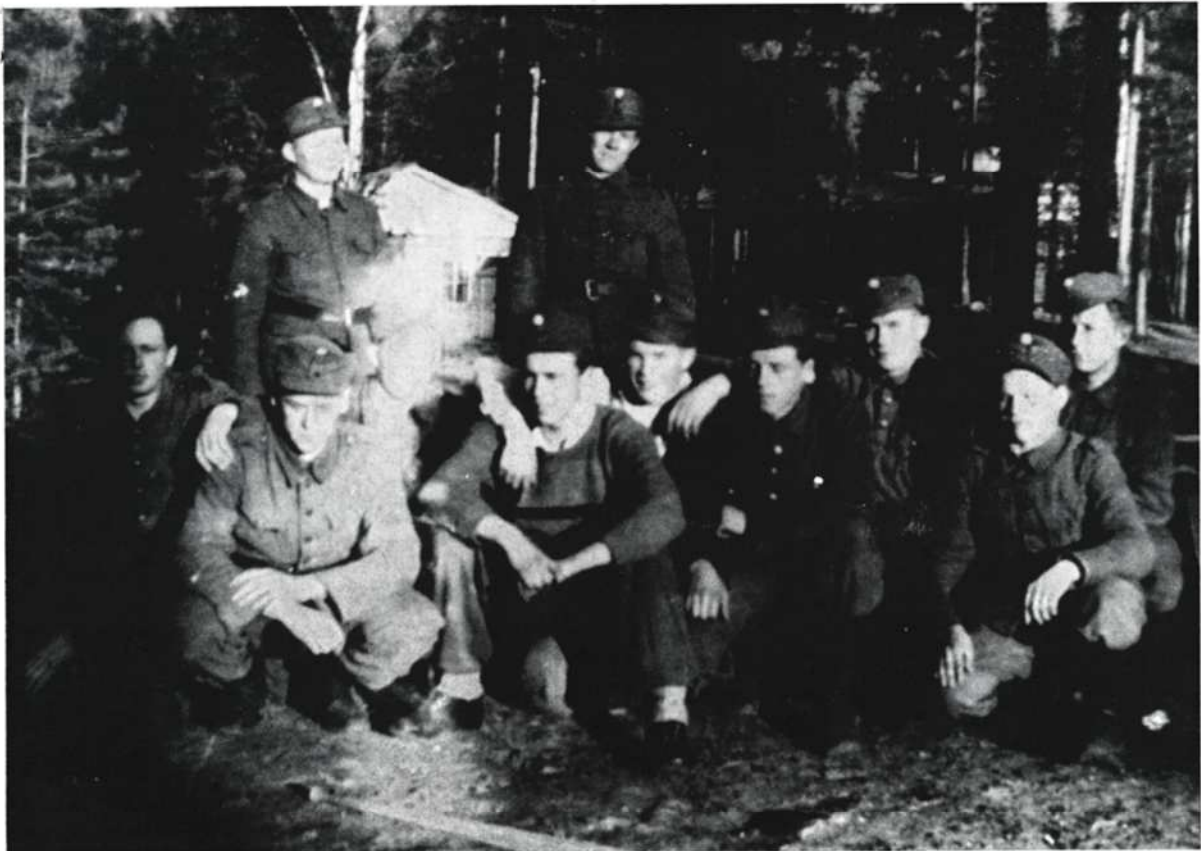
Parakkikylän pojat vapaa-ajan vietossa. Taustalla JR 3:n majoitusparakkeja Kontiorannassa nykyisen lämpökeskuksen mäellä.

Sota-ajan kokemusten jälkeen tuntui oudolta saada kak-