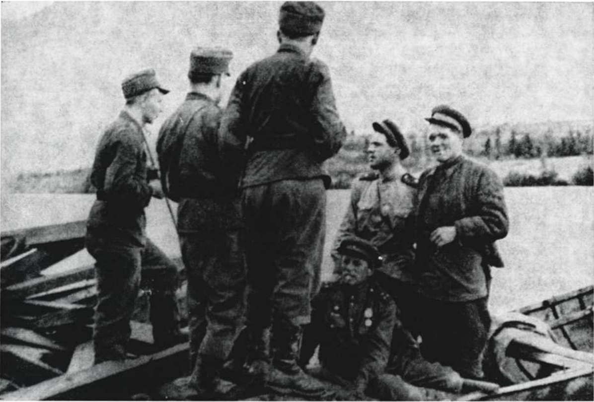
Suomalais-neuvostoliitolaisten veljeilyä heti sotatoimien päätyttyä 4. 9. 1944.