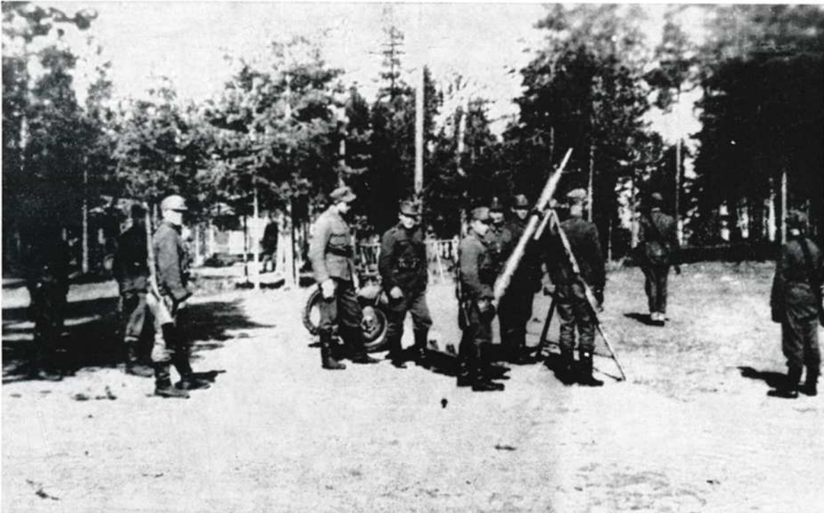
Krh-komppania harjoituksissa kesällä 1946 Kontiorannan varuskunnassa.

Koulutus sujui jokseenkin hyvin alusta alkaen, vaikka esimerkiksi tämän kirjoittaja joutui krh-ryhmän johtajaksi