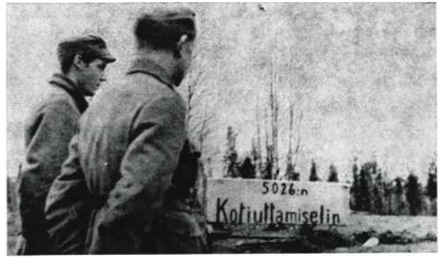
Kotiuttamiselimen kautta alkoi veteraanien tie siviiliin...

Syyskuun 4. päivän vastaisena yönä saatiin suomalaiselta valtuuskunnalta Moskovasta tieto, että venäläiset suostuvat tulen lopettamiseen seuraavana aamuna klo 7. Kaikille suomalaisille joukoille annettiin määräys lopettaa tuli tuona ajankohtana. Mannerheim kertoo muistelmis-