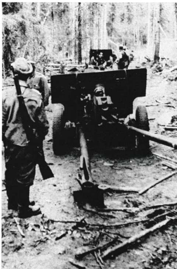
Jatkosodan viimeinen taistelu on päättynyt Ilomantsissa 1944