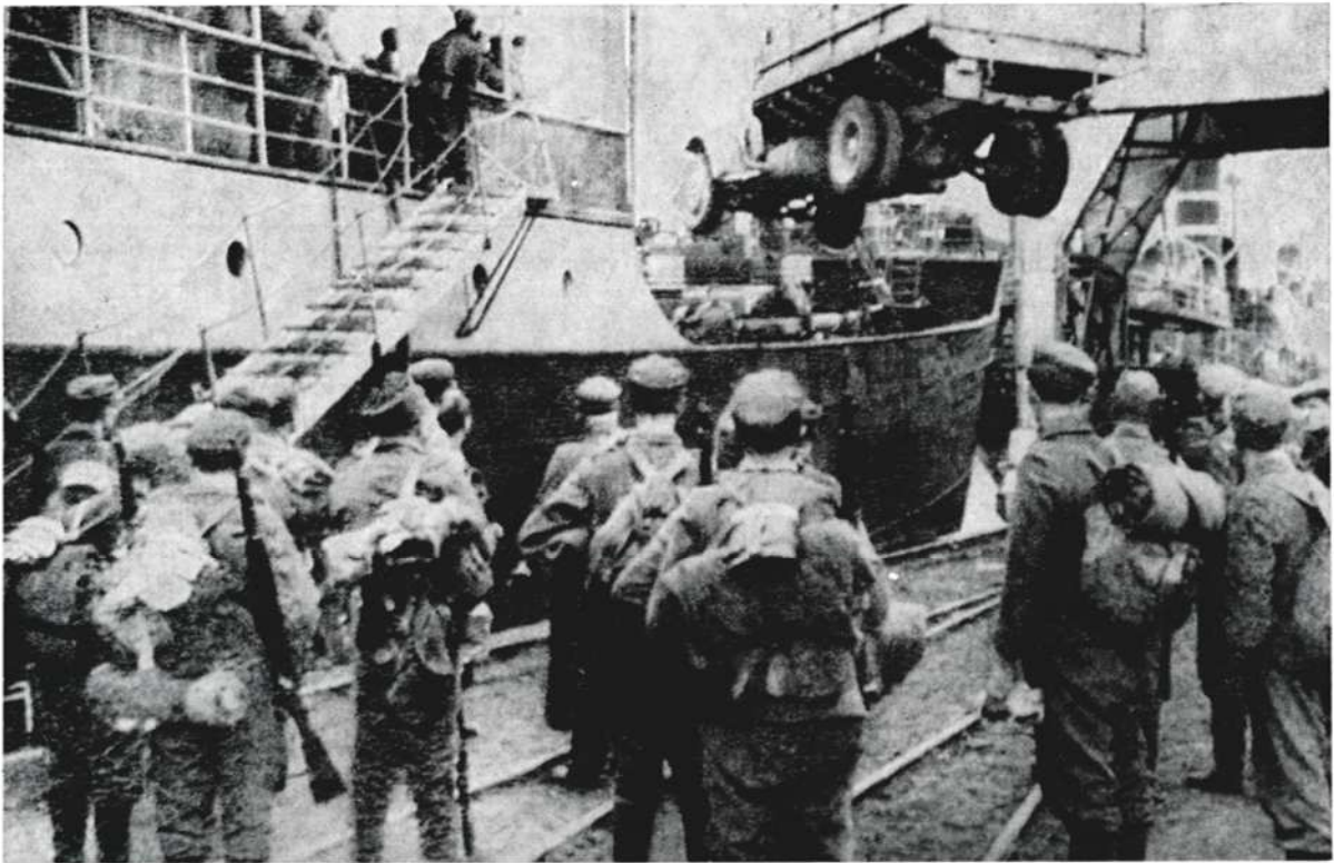
Suomalaisia asevelvollisia nousemassa laivoihin Oulun satamassa. Maihinnousu Kemiin ja Lapin sota ovat alkamassa.

ja Utsjoen suunnalla. Kuitenkin vasta huhtikuun 25. päivänä viimeiset saksalaiset oli ajettu Norjan puolelle ja Jatkosota päättyi.