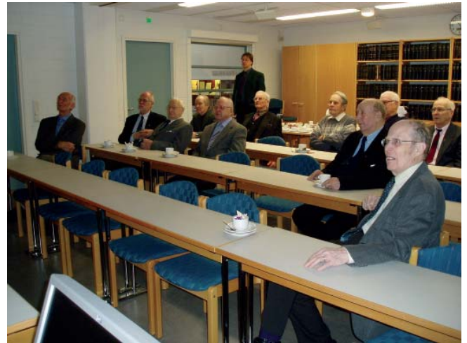
Helmikuussa vierailimme Joensuun Maakunta - arkistossa.