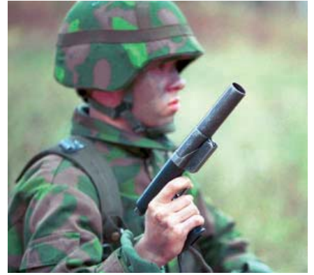
25 VAPIST 43, SA kuva.

Elinkaariajatteluun kai liittyy se, että jonain lähitulevaisuuden hyvin suunniteltuna päivänä tulee korvata Suomen Puolustusvoimien valopistoolin lisäksi rynnäkkökivääri ja kevyt konekivääri täysin uudella järjestelmällä. Olisipa ne tulevaisuudessakin suomalaisvalmisteiset.