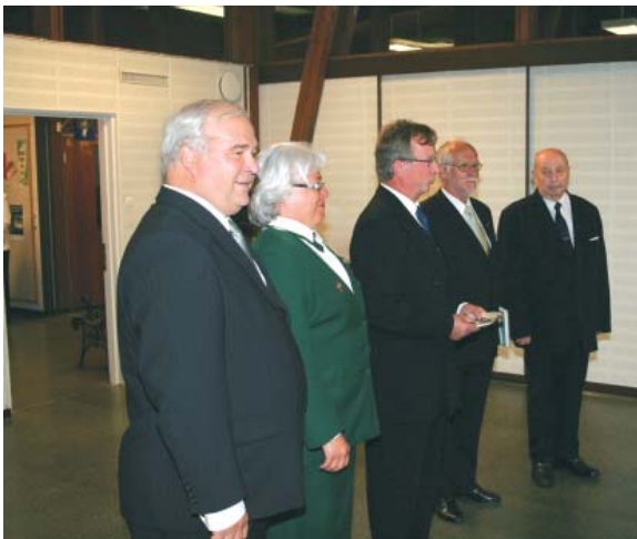
Prikaatin killan edustajat tervehdysvuorossa.