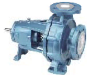
Flowservice – Prosessipumput