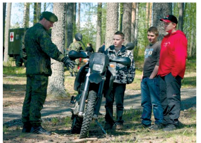
Prikaatin komentaja esitteli oppilaille KTM-moottoripyörää.