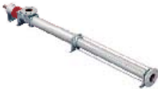
Mono – Epäkeskoruuvipumput