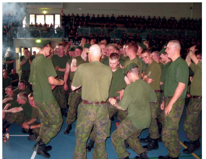
Tunnelma kohosi hallin kattoon.