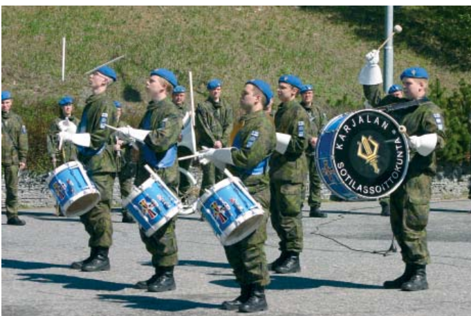
Karjalan Sotilassoittokunnan rumpuryhmä.