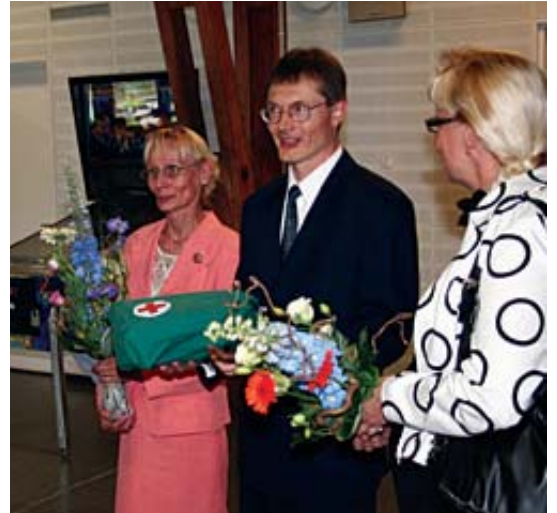
Lääkintähuoltokeskuksen henkilöstö toi komentajalle oman tervehdysensä ensiapulaukun muodossa.