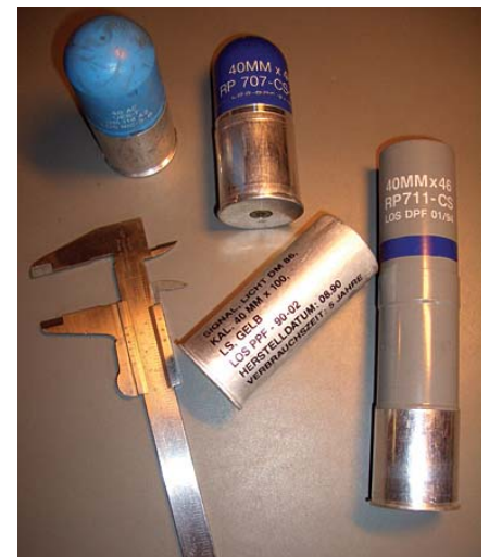
40 mm kranaattipistoolin erikoispatruunoita, merkinanto, CS-kaasuammus ja harjoitusammus (vaaleansininen).