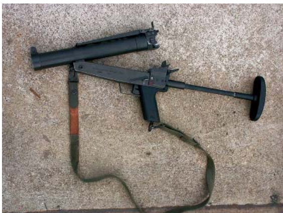
40 KRPIST 2002.