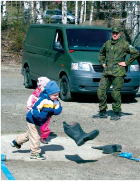
Niin isot kuin pienetkin saivat kilvoitella muun muassa saappaanheitolla.