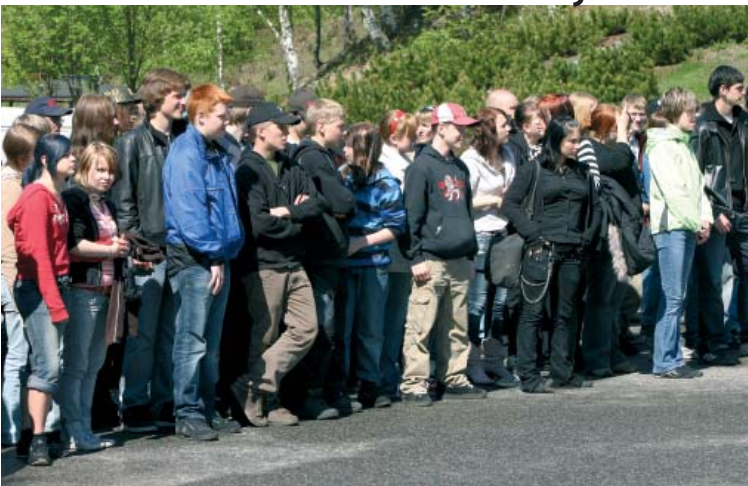
Kontiolahden koulun kahdeksansien luokkien oppilaat olivat tutustumassa prikaatin koulutukseen ja toimintaan iltpäivällä.