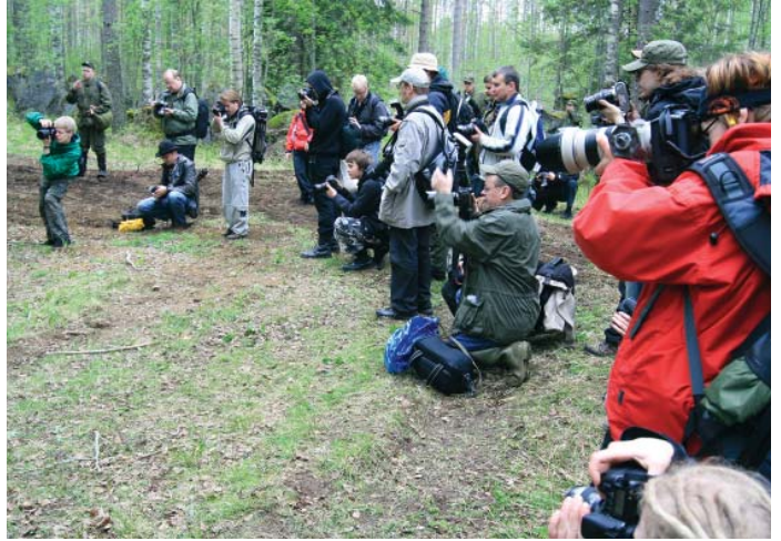
Kilpailuun osallistui valokuvaajia ympäri Suomea.