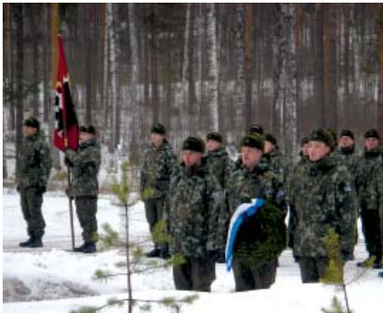
270vuorokauttapalvelleiden kotiuttaminen huhtikuussa.