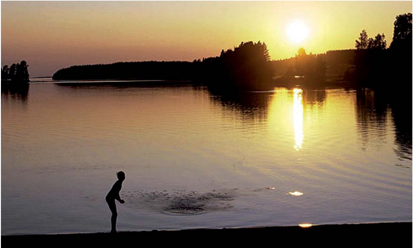
Auringon lasku Puruvedellä, Kesälahden kunnassa.