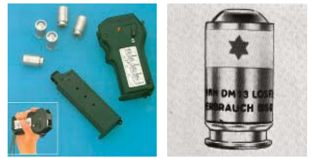
HK EFL mainoskuva, Kuva 19 x 36 mm jossa näkyy patruunasta DM13 patruunasta. noita.