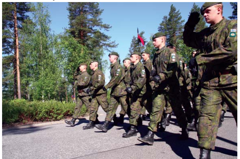
Tilaisuuksia vietettiin Kollaan Vasamalla ja sotilaskodissa. Suvikahvitilaisuudessa muistettiin perinteisesti 4.6. ylennettyjä ja palkittuja.