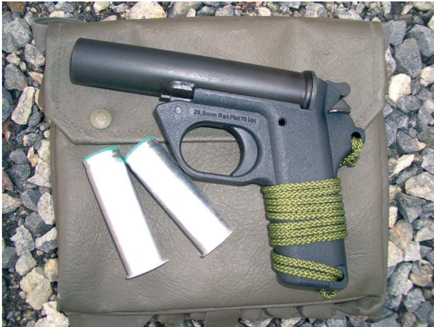
26,5 x 80 mm HK P2A1 merkinantopistooli ja kaksi patruunaa.