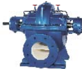
Flowservice – Vesipumput