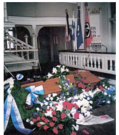
Teksti: Eversti Ensio Koivisto

Eteläpohjalainen sotainvalidi- ja veteraaniväki jää kaipaamaan suurta isänmaan ystävää.