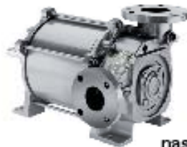
nash_elmo – Nesterengaspumput ja koneikot