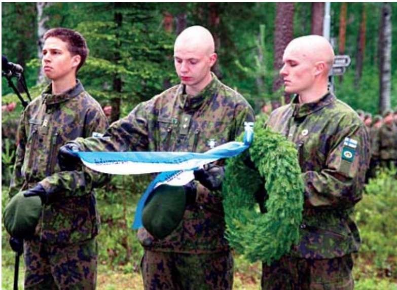
6.7.2007 seppeleen laskijat Kollaan Vasamalla.