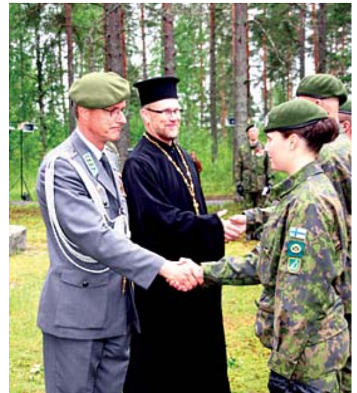
Upseerikokelaat ovat juuri ylenetty vänrikeiksi.