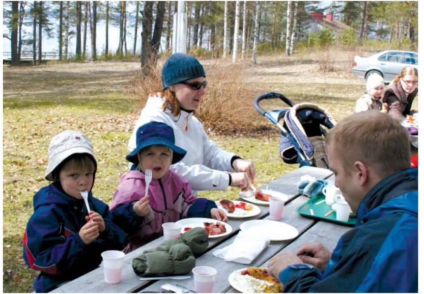
Aurinko pastoi ja grillimakkara maistui. Huovisen perhe välipalalla.